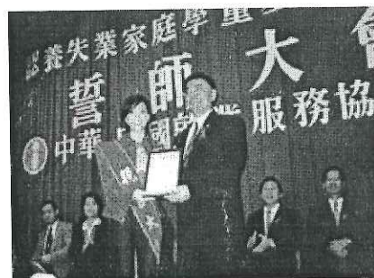
歌壇天后 張惠妹受邀擔任「認養失業家庭學童運動」親善大使