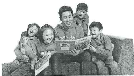
本土天王 羅時豐受邀擔任「認養失業家庭學童運動」親善大使