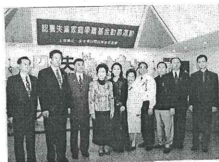
前總統 呂秀蓮女士參加「認養失業家庭學童運動」記者會