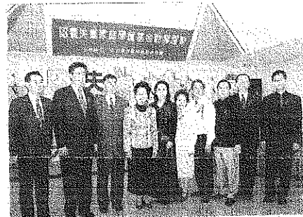
前總統 呂秀蓮女士參加「認養失業家庭學童運動」記者會