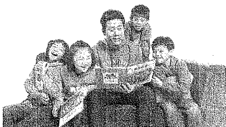
本土天王 羅時豐受邀擔任「認養失業家庭學童運動」親善大使