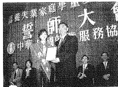
歌壇天后 張惠妹受邀擔任「認養失業家庭學童運動」親善大使