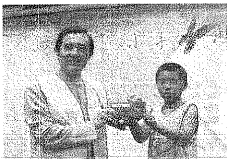
榮邀 馬總統英九先生擔任「認養失業家庭學童運動」最佳代言人