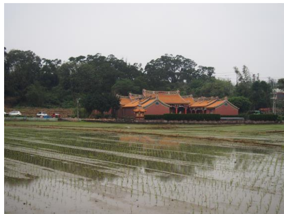
(圖 4)吳氏客家祖堂「至德堂」