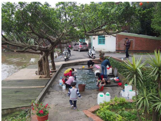
(圖 3)石母娘娘浣衣池