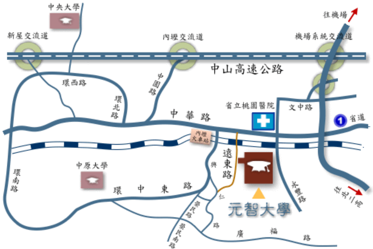
元智大學校區平面圖