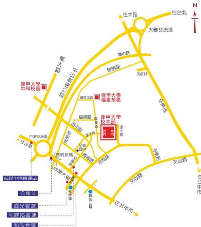
逢甲大學地理位置